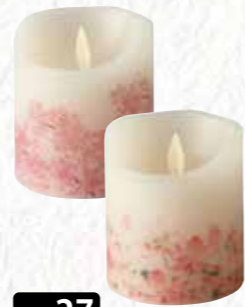
No.27 灯ととなり (桜・蓮)