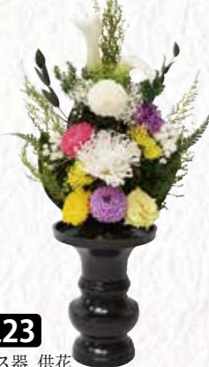
No.23 ガラス器 供花 「オーロラ 空色」