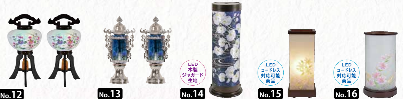
No.12 菊 絹一重 5寸 黒檀調 LED 1対 [H31cm] 24,000円 税込 No.13 水泡灯 ゆきび水泡 1対 [H29cm] 19,000円 税込 No.14 民芸灯 胡蝶蘭流水 LED 木製 ジャガード 生地 [H45cm] 15,500円 税込 No.15 京灯り ほのい LED LED コードレス 対応可能 商品 [H36cm] 14,300円 税込 No.16 京灯り まとい LED LED コードレス 対応可能 商品 [H35cm] 14,300円 税込