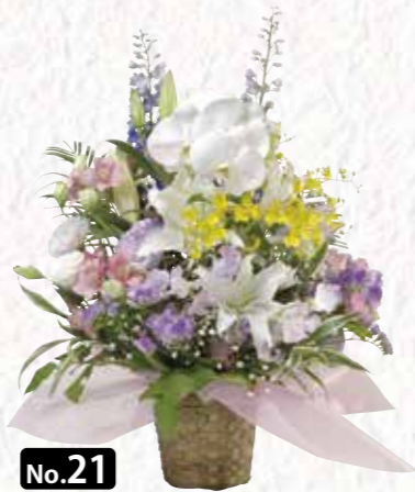
No.21 法事花 1基