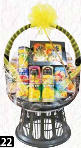
No.22 法事用 盛籠