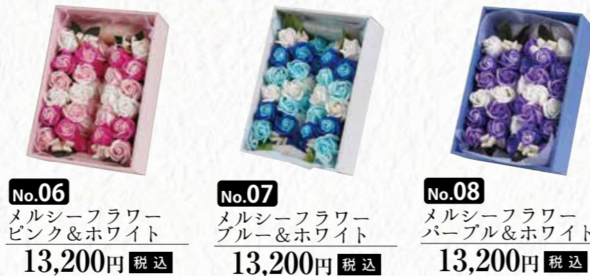
No.06 メルシーフラワー ピンク&ホワイト 13,200円 税込 No.07 メルシーフラワー ブルー&ホワイト 13,200円 税込 No.08 メルシーフラワー パープル&ホワイト 13,200円 税込