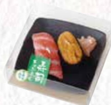
No.32 寿司 (ウニ・大トロ)