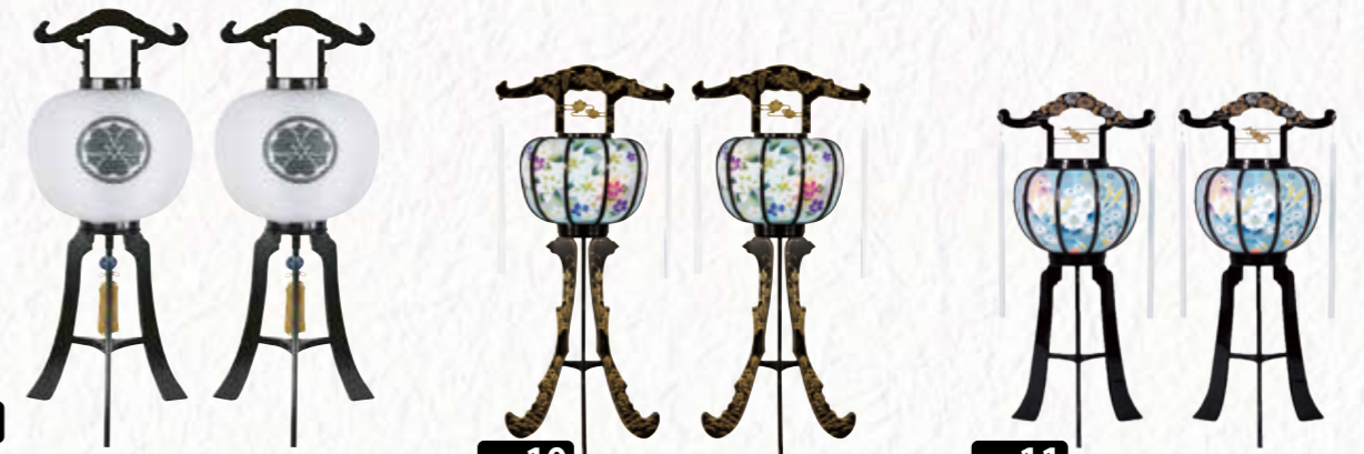
No.09 無地灯袋二重尺二 黒檀調家紋入り 1対 [H90cm] 60,000円 税込 No.10 カサブランカ 黒 LED 1対 [H88cm] 20,000円 税込 No.11 松風灯 花鳥 黒 1対 [H68cm] 17,000円 税込

その一つとして「献灯」としての灯籠のあかりは、故人が迷うことなく安らかに浄土へ旅立つ「導きの灯り」としての役割があります。