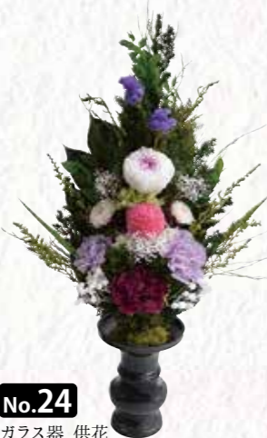
No.24 ガラス器 供花 「オーロラ 薄紅」