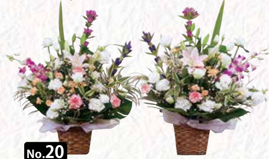
No.20 法事花 1対