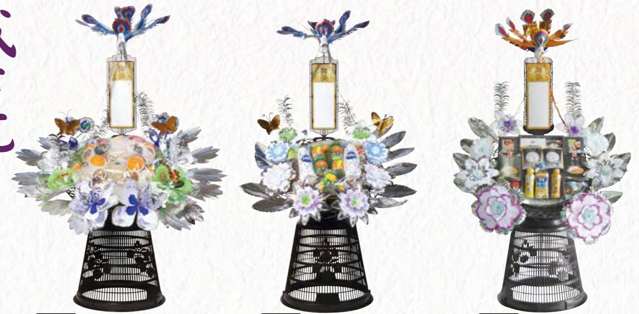
No.17 盛籠 フルーツ 17,000円 税込 No.18 盛籠 缶詰 17,000円 税込 No.19 盛籠 バラエティセット 17,000円 税込