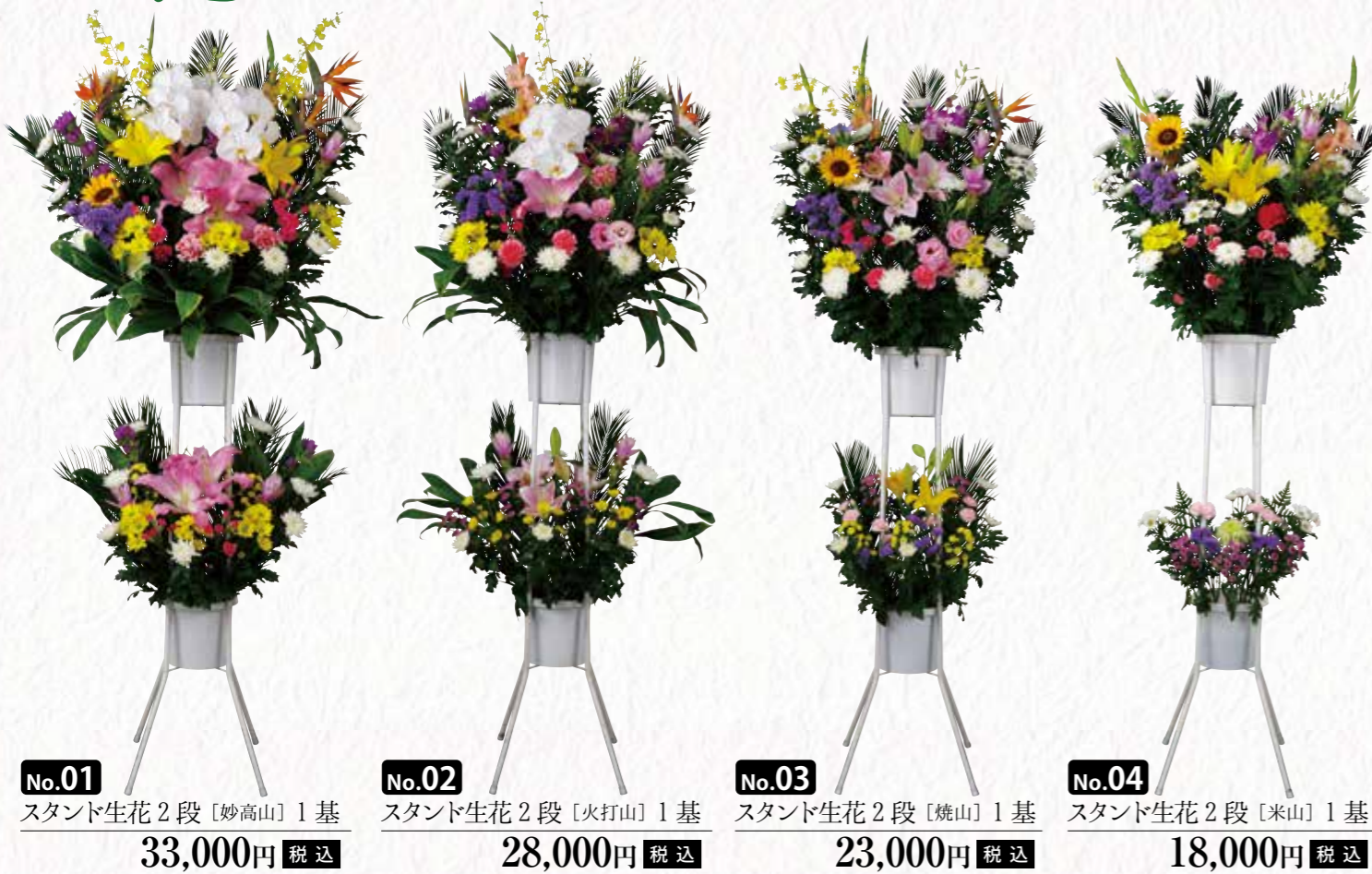
No.01 スタンド生花 2段 [妙高山] 1基 33,000円 税込 No.02 スタンド生花 2段 [火打山] 1基 28,000円 税込 No.03 スタンド生花 2段 [焼山] 1基 23,000円 税込 No.04 スタンド生花 2段 [米山] 1基 18,000円 税込

供花はお悔やみの気持ちを込めた弔意として、故人様に供える生花(お花)のことです。霊をなぐさめるという意味をもっています。ご親族をはじめ亡くなられた方と親交のあった人が送る最後の贈り物とされています。故人様とのお別れも悲しみが少しでも癒えることを願ってという意味もあります。